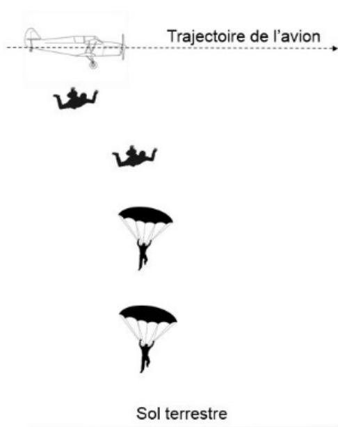
Saut depuis un avion